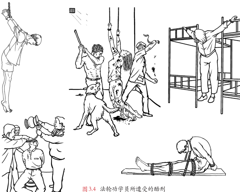
图3.4 法轮功学员所遭受的酷刑

中共迫害法轮功，不仅违反了《宪法》中的规定——公民有信仰自由、言论自由、集会结社自由等等权利，而且还犯下了《刑法》中的故意杀人罪、侮辱罪、诽谤罪、绑架罪、敲诈勒索罪等等多种罪行。