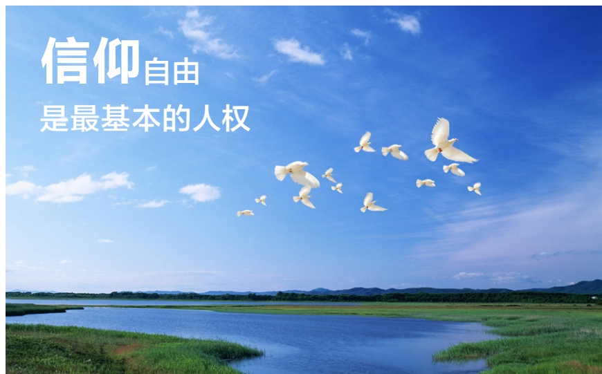
图 3.2 信仰自由是公民最基本的人权