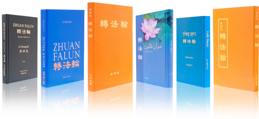
图 6.1 各种语言版本的《转法轮》，可在法轮大法网站 falundafa.org 免费下载。