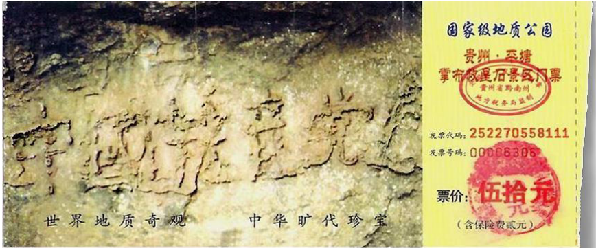
图 5.2 贵州平塘“藏字石”景区门票

活摘法轮功学员器官，又添累累血债。中共崇尚斗争哲学、功利主义，用暴力和金钱维持政权。一方面与天、地、人斗，竭泽而渔；一方面贪官污吏层出不穷，穷奢极欲，导致自然灾害、社会乱象频出。底层民众的生活、尊严、生命得不到应有的保障，百姓如同草芥；疫情、火灾、洪灾、地震，极端天气频现，天灾人祸不断，天怒人怨。这样罪恶累累的中共，上天还能容它吗？