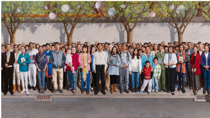
图 3.1 油画：《一九九九年四月二十五日》局部，作者：孔海燕。

的方方面面都已暴露得淋漓尽致，每个人都能随口举出一堆实例，再粉红也难以否认。对内，中国人内卷没底线，用极端自私、伤天害理、杀人害命都不足形容，而且是举国上下笑贫不笑娼、黑白颠倒、善恶倒悬。在海外，粉红们通过翻墙、旅游、留学、移民，在全世界反反复复地把中国人的家丑翻晒出来，他们不是生怕世界上不知道中国人的丑陋，而是被中共教得无知、无耻和自私。