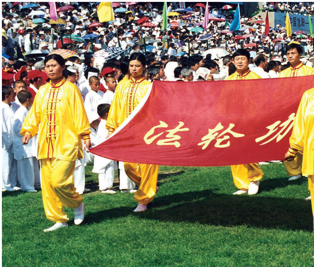
图1.2 1998年8月20日,法轮功队伍在“中国沈阳-亚洲体育节”的开幕式上入场。