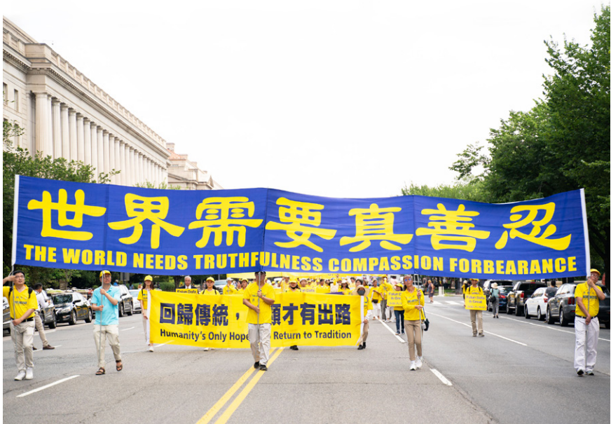
图3.5 世界需要真善忍

面对今天中国社会的道德乱象，回首1999年的“四·二五”和平大上访，法轮功学员维护信仰“真、善、忍”的自由，争取做道德高尚的好人的权利，就愈加显示出其辉煌的历史意义。