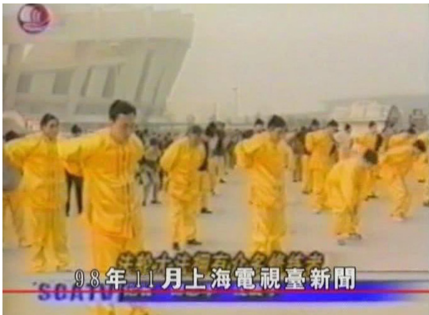
图 1.1 1998 年 11 月 24 日，上海电视台报道法轮功。（视频截图）

◆ 1998 年 8 月 28 日，《中国青年报》以“生命的节日”为题，介绍了“1998 年中国沈阳-亚洲体育节”上法轮功队伍的良好表现和法轮功的健身效果，并配以两幅法轮功学员参加开幕式的压题照片。