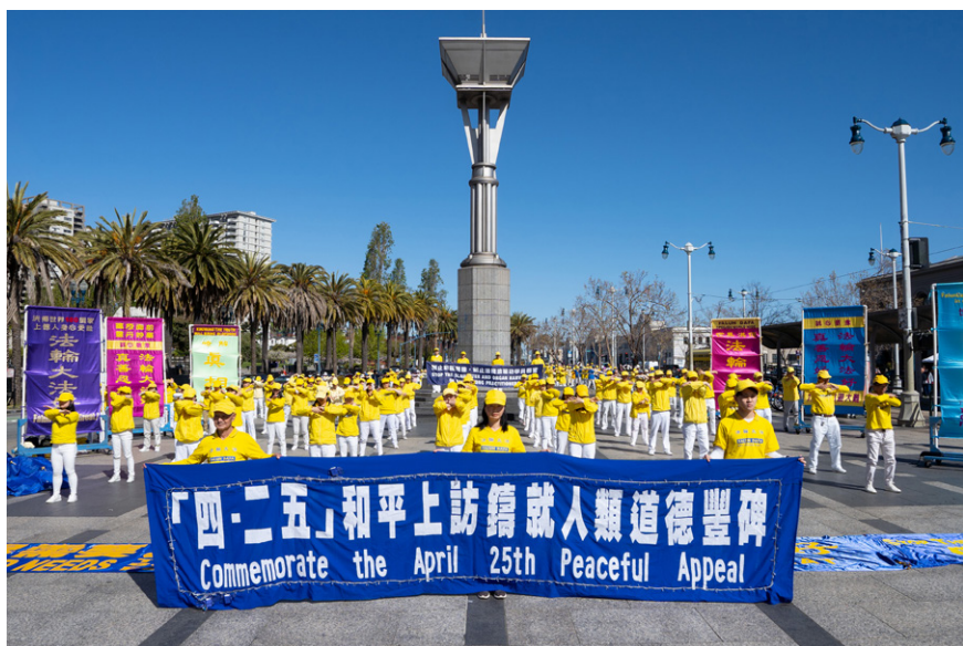
图 3.3 2023 年 4 月 22 日，法轮功学员在美国旧金山纪念“四·二五”上访 24 周年。

谨以此文，献给25年前的那个“四·二五”，纪念那座“真、善、忍”铸就的道德丰碑。