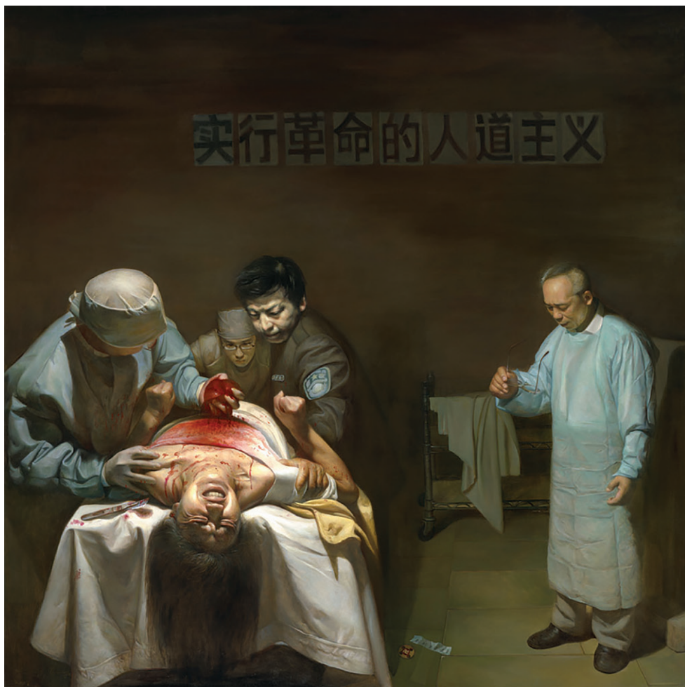
活摘器官 油画 董锡强 2007

这幅画表现的是法轮功学员被活摘器官的残忍场景。法轮功学员痛苦的表情、暴涨的青筋、握紧的双拳，似乎在发出无声而又撕心裂肺的呐喊，和警察的冷酷、医生的专业神态形成鲜明的对比。具有讽刺意义的是墙上挂着的横幅——“实行革命的人道主义”，揭示了中共好话说尽、坏事做绝的邪恶本质。画家意图通过这幅画来唤起人们的良知。