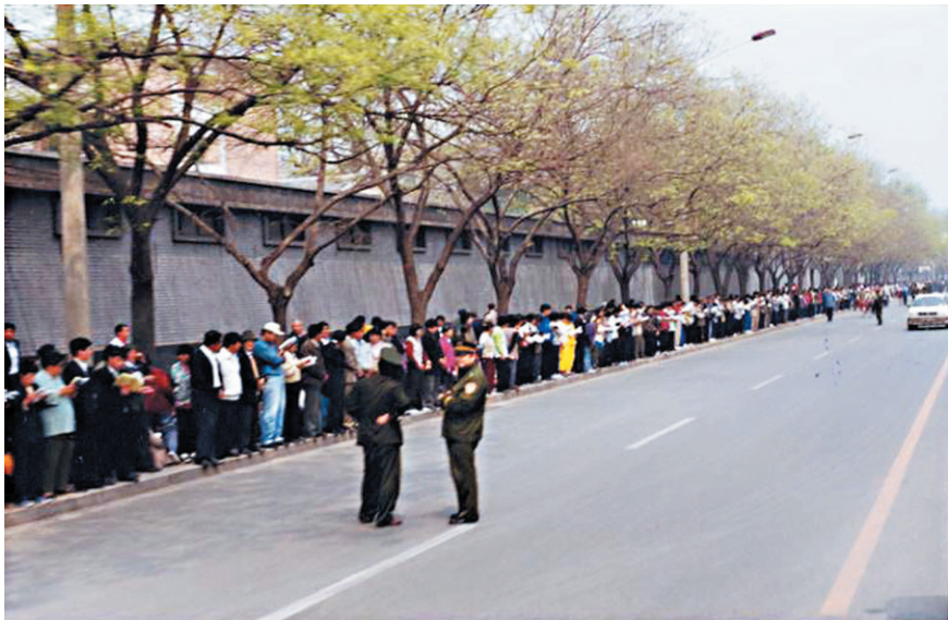
图1.4 历史图片：1999年4月25日，“四·二五”上访现场。