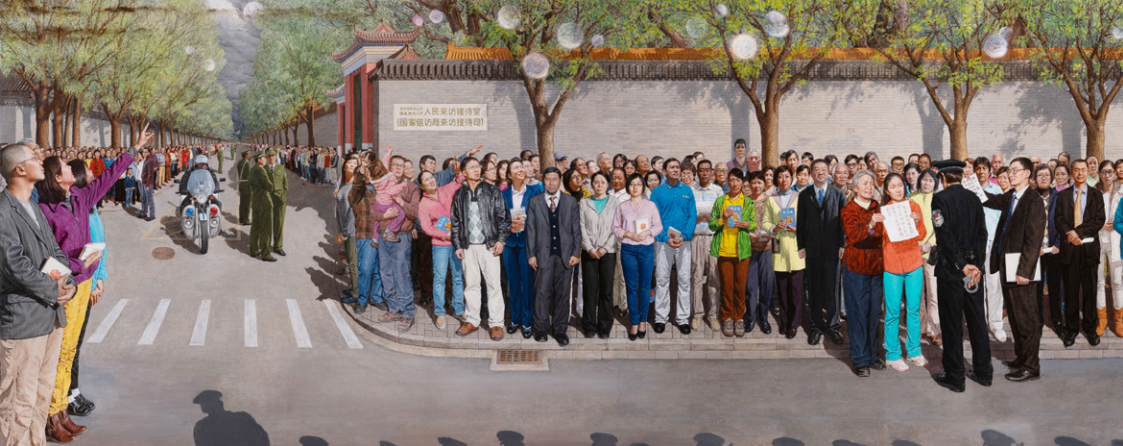
一九九九年四月二十五日 油画 孔海燕 2019