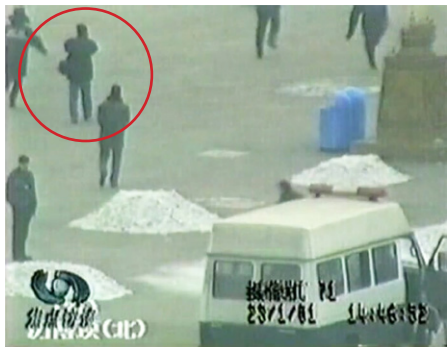
图4.3 背着摄影包的男子

在“自焚”录像上能看到有一个背着摄影包的男子在天安门广场的军警中间自由地拍摄。（右图）