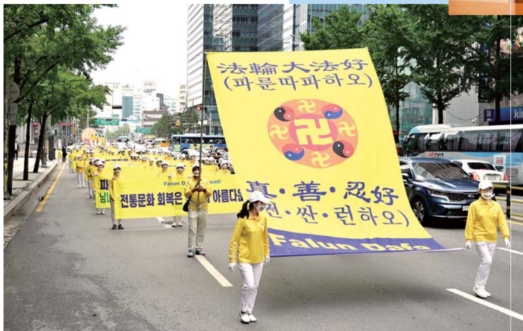
■ 二零二零年七月十九日，韩国首尔，当地法轮功学员举行大游行。图为游行队伍中的巨型标语“法轮大法好 真善忍好”。

■ 韩国著名电视剧编剧金炅一（炅的读音同“窘”），在绝境时认真阅读了《转法轮》，重获新生。