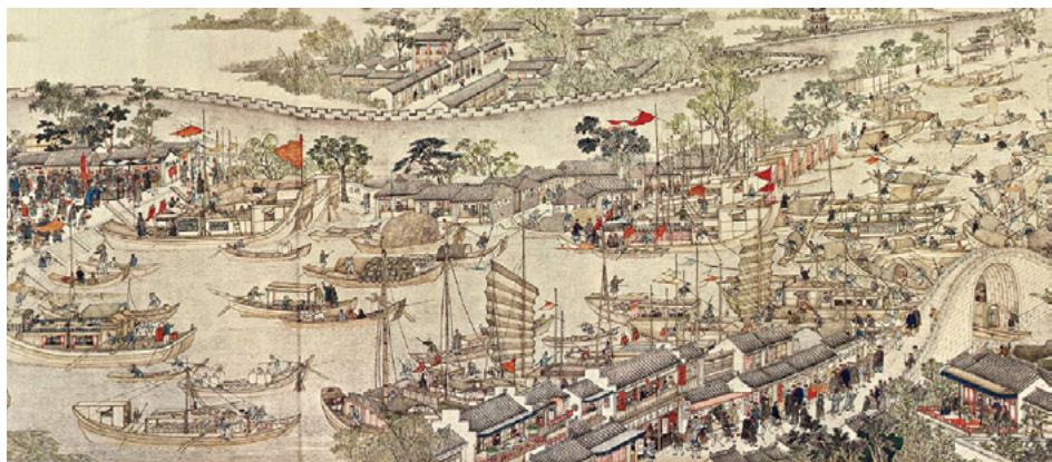
康熙乾盛世，是整个清朝的黄金时代，缔造了中华帝国体系中最后一个高峰。图为清徐扬绘《姑苏繁华图》局部。

康熙对施琅的支持和信任，使得施琅能够全力放手一击，并在战争胜利时不计个人恩怨地宽待俘虏，使归降者心服口服。