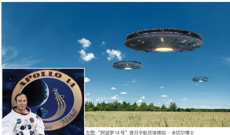
左图：“阿波罗14号”登月宇航员埃德加·米切尔博士