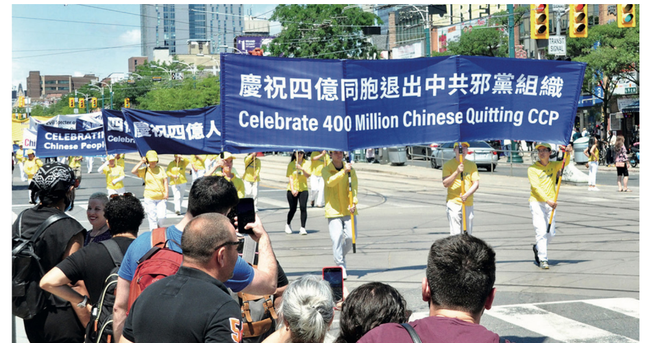
■ 2022년 8월 6일, 캐나다 토론토의 일부 파룬궁 수련생들이 4억 중국 동포의 평안을 위한 삼퇴를 경축하고 있다.

베이징 시간 2022년 8월 3일 오후 7시까지, 탈당 홈페이지에서 중공의 공산당, 공청단, 소선대 조직에서 탈퇴 성명을 발표한 인원이 4억 명을 넘어섰다.