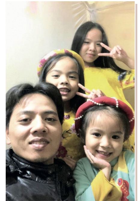
투히엔타의 남편과 세 딸

하지만 마지막 몇 차례 화학치료에서 그녀는 몸과 마음이 극도로 시달려 포기하고 싶었다. “48시간 동안 계속 구토해 물과 음식을 먹을 수 없었고, 남편에게 죽여달라고 빌기도 했습니다.” 그녀의 고통을 보면서 가