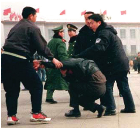
▲ 2000年法轮功学员在天安门广场和平请愿，遭到警察及便衣的殴打。

大搞监控，把大数据、人脸识别、人工智能等高科技用来打造限制人民自由的天罗地网。所以，没有人权保障的这场经济盛宴，注定不会出现经济发展带来的政治自