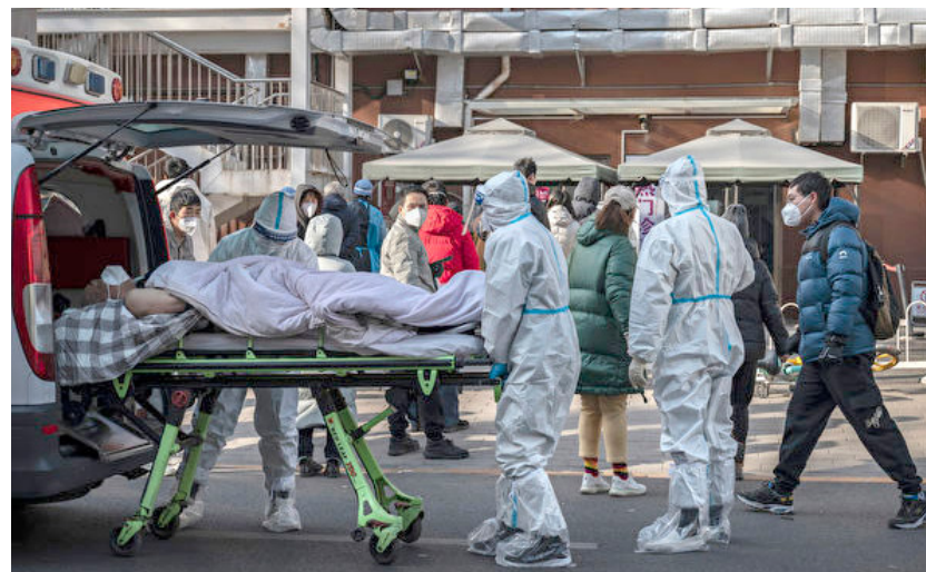
◀ 图为 2022 年 12 月 9 日，在中国北京，医务工作者穿着防护服，用担架抬病人到医院发烧诊所。