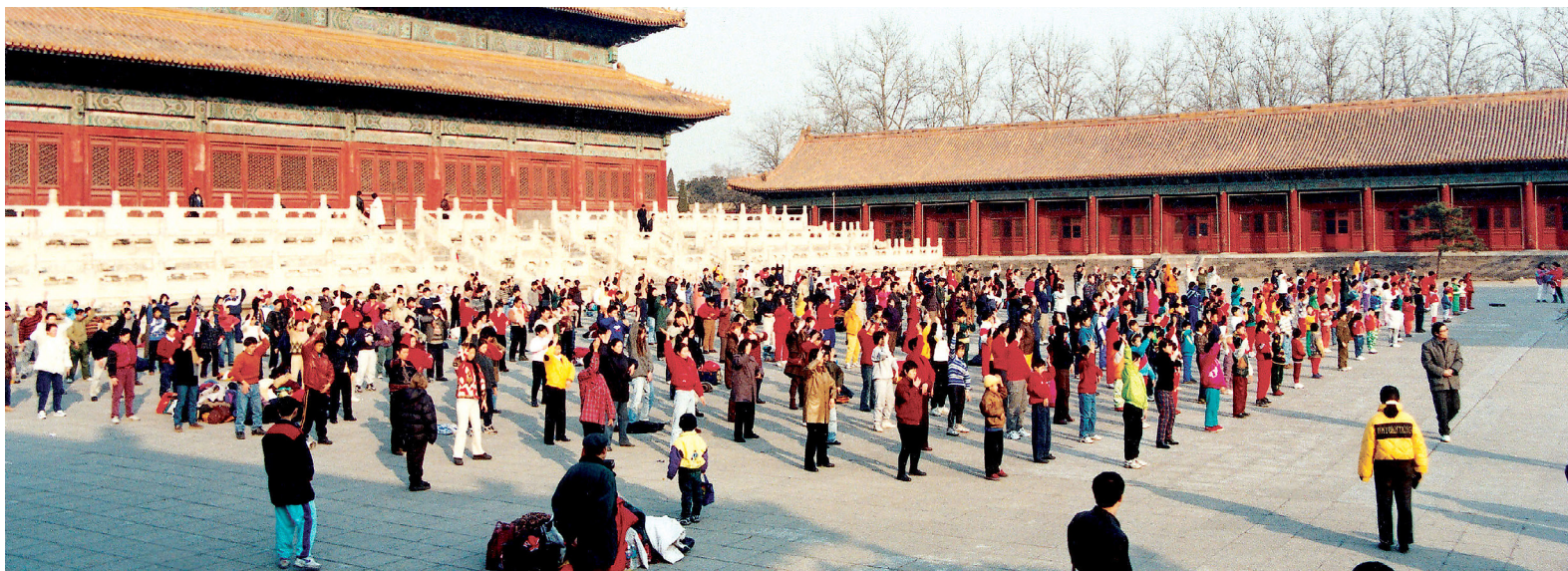
▲ 在江泽民下令迫害前，北京劳动人民文化宫的 Falun Gong 小学员练功点，多人受益。