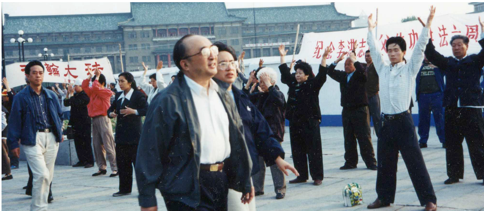
▲ 1998年5月, 国家体委主任伍绍祖来长春调查法轮功情况, 当下依旧和平。1999年后伍绍组屈服于中共的淫威, 被迫攻击法轮功。

如果江泽民没有镇压法轮功, 会有更多人从法轮功中受益。一个信仰真、善、忍的人, 他的高尚行为还会影响到身边更多的人。这个社会信仰真、善、忍的人越多, 这个社会的道德就越高尚。那么, 在中国经济发展的过程中, 就有一股来自民间的社会力量在维护着道德, 相信“人在做、神在看”, 相信善恶有报。经济发展了, 社会道德维持在比较好的水平, 就不会普遍存在今天的