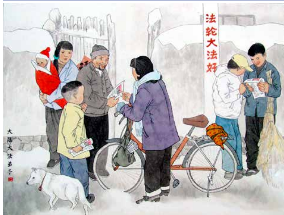
■ 绘画：大法福音救世人

三退保平安。当我拿出刊有李洪志师父经文的《明慧周报》给他看时,只见他眼睛一亮,说:“我要这个!”他恭恭敬敬地站直,郑重地说:“谢谢你!谢谢李洪志大师!”他退出了曾经加入的少先队。我把周报放在他的衣袋里,叮嘱他要珍惜!