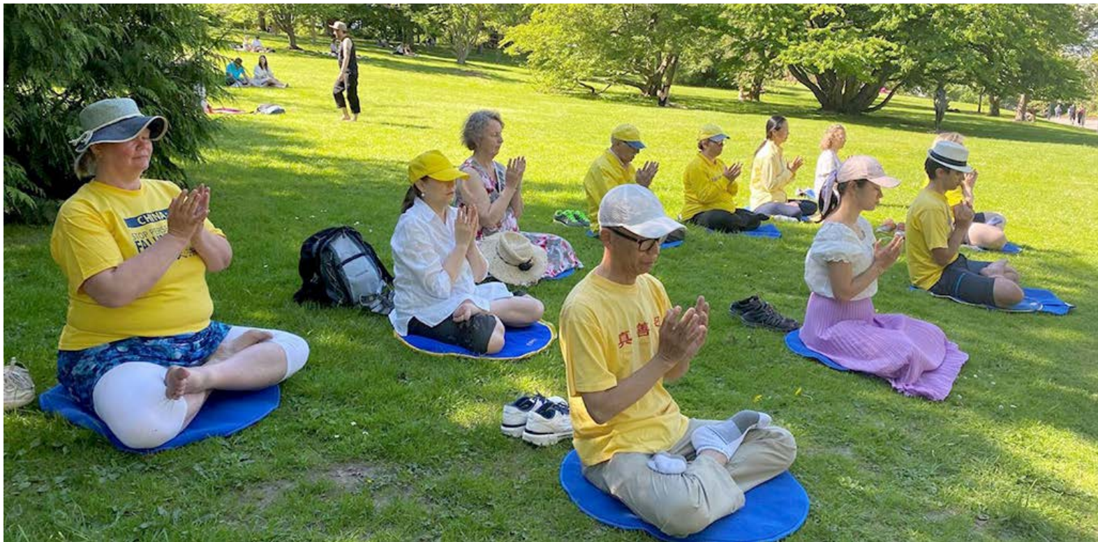
▲ 许多法轮功学员得法后纷纷受益，主动在哥德堡的植物公园举行弘法活动。

帮我们调整身体，我的注意力始终跟随着师父。学习班结束后，我感到心情愉悦、走路一身轻，端坐在驾驶室里开着车，很轻松地就到家了。来的时候那个令人烦恼的腰疼，也不知道什么时候消失的。”