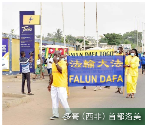
多哥 (西非) 首都洛美