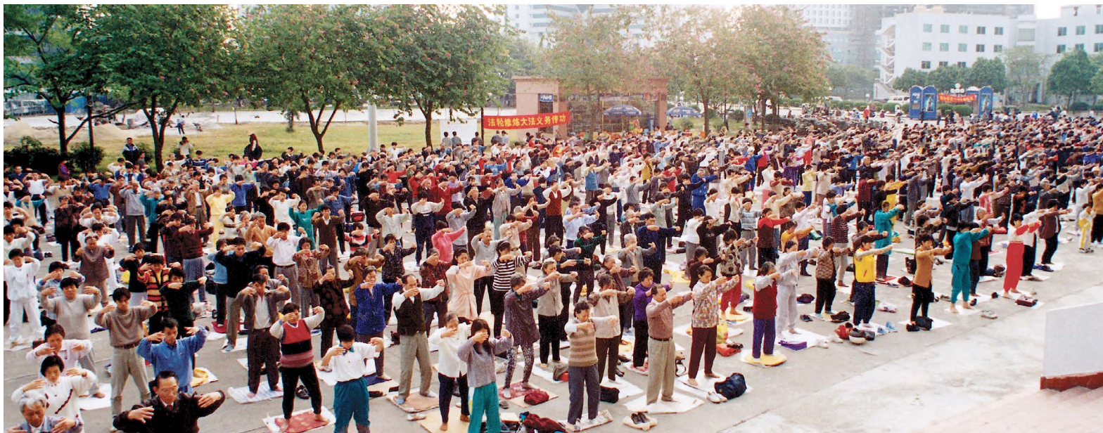
▲ 北京举办过 13 期法轮功传授班。图为学员晨炼盛况。

为修炼原则，自 1992 年公开传出后，因为祛病健身功效显著、功法简单易学、免费教功等特点，受到广大群众的喜爱。从 1996 年开始，修炼法轮功的人数迅速增长，中共各大部委也有越来越多的人开始炼功。到 1999 年，中国大陆学炼法轮功者已达 1 亿人。