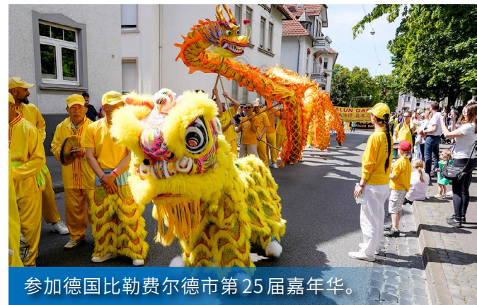
参加德国比勒费尔德市第25届嘉年华。