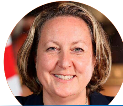
安妮·玛丽·特雷维利安议员

了严重的虐待。承诺英国政府将密切关注，并将继续向中国施压，要求其立即结束对人权的严重侵犯。同时对法轮大法日表示祝贺。