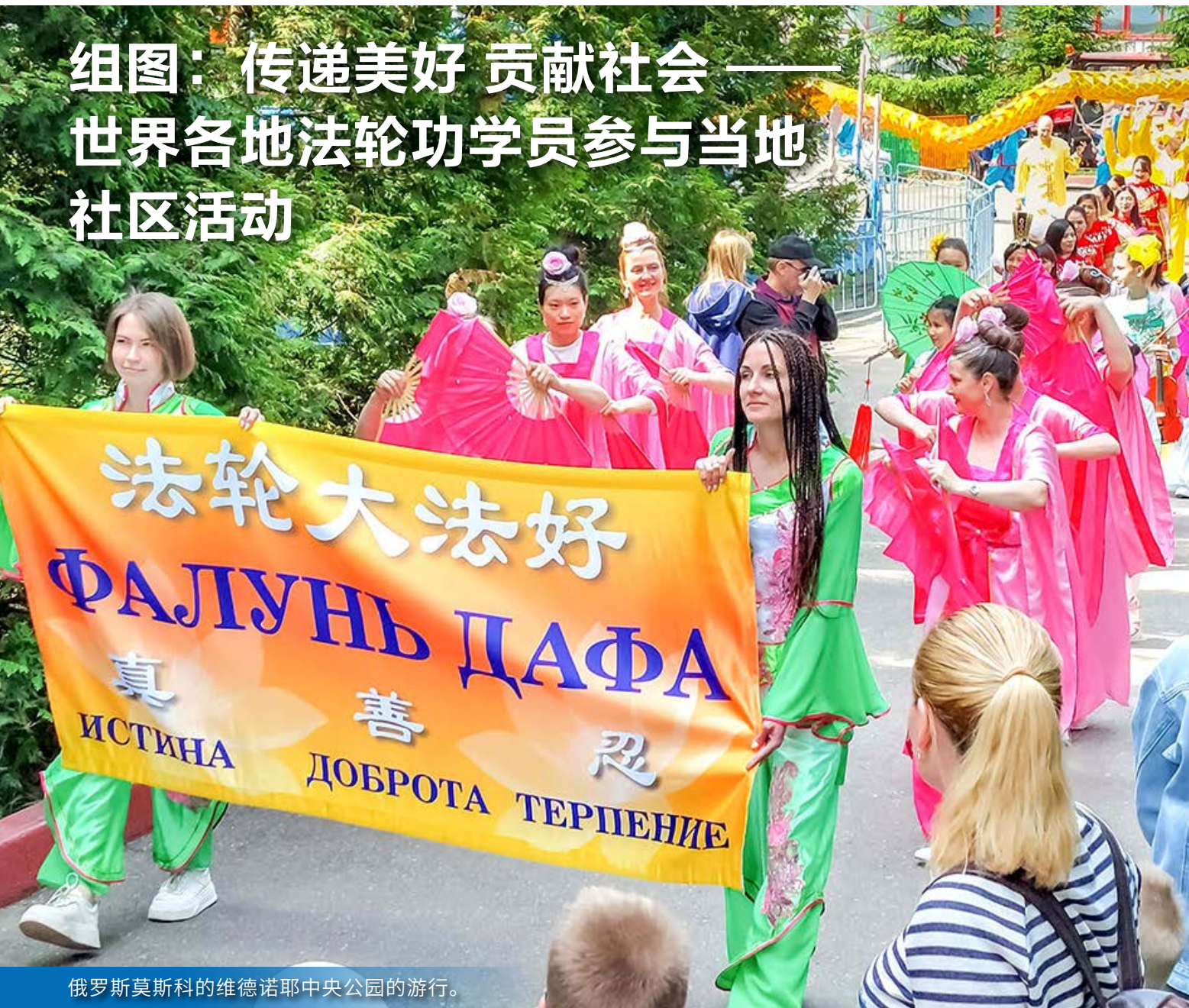
俄罗斯莫斯科的维德诺耶中央公园的游行。