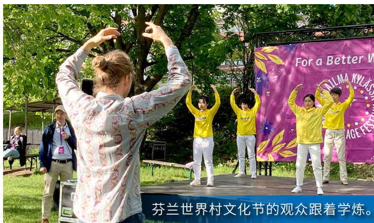
芬兰世界村文化节的观众跟着学炼。