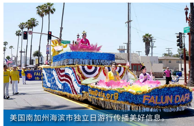
美国南加州海滨市独立日游行传播美好信息。