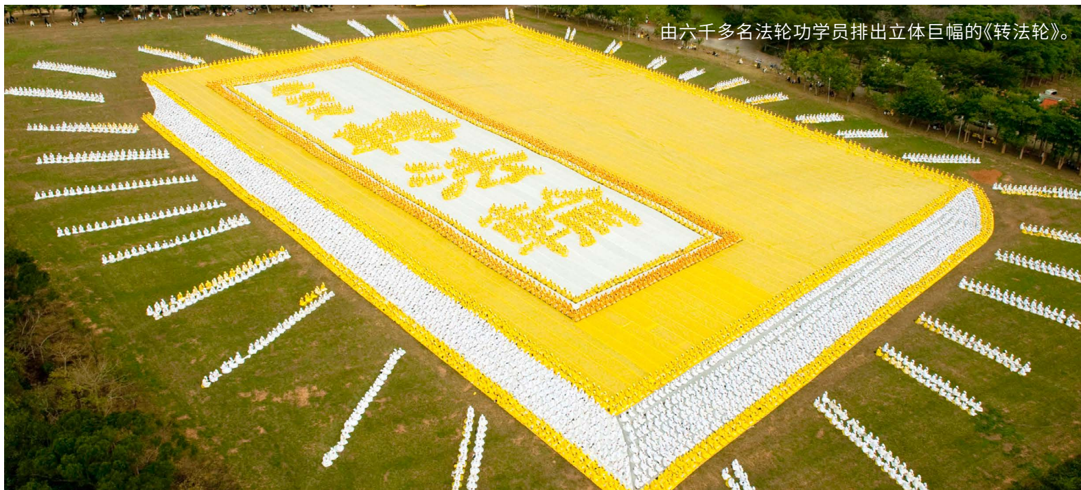
由六千多名法轮功学员排出立体巨幅的《转法轮》。

高考结束后，我与爸爸去炼功点上和大家一起读《转法轮》。一天爸爸在和大家谈心得体会时说：“如果没学法轮功的话，我姑娘高考后，