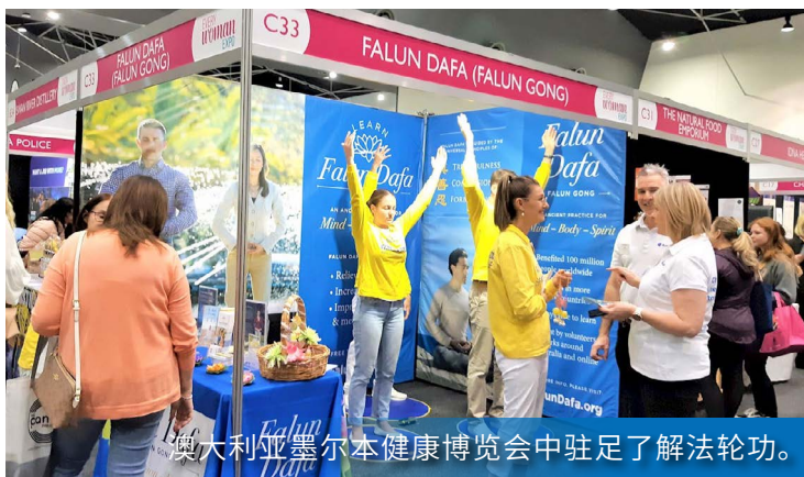
澳大利亚墨尔本健康博览会中驻足了解法轮功。