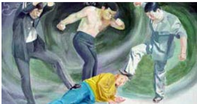
▲ 中共殴打酷刑示意图。