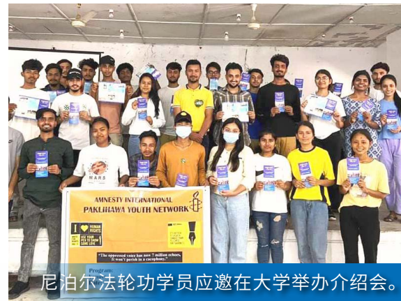
尼泊尔法轮功学员应邀在大学举办介绍会。