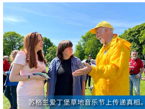
苏格兰爱丁堡草地音乐节上传递真相。