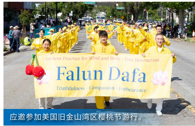
应邀参加美国旧金山湾区樱桃节游行。