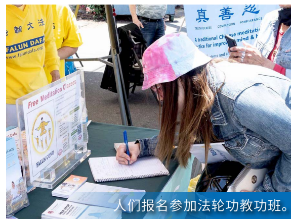
人们报名参加法轮功教功班。