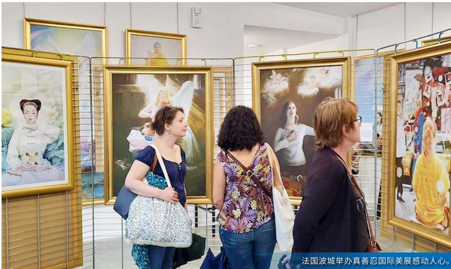
法国波城举办真善忍国际美展感动人心。