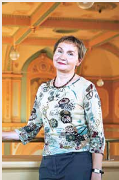
■ 澳洲画家芭芭拉·谢弗。