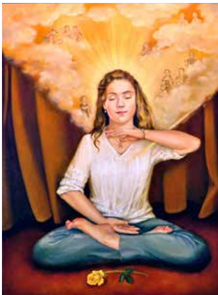
■ 芭芭拉·谢弗的作品。

生活中，提醒我总是先想到别人；遇到矛盾，首先找自己的原因，没有委屈、没有气恨，生命变得如此充实和不同凡响。在炼功中，感到身体每一个细胞都充满能量。这真是奇妙的生命净化和升华的体验。