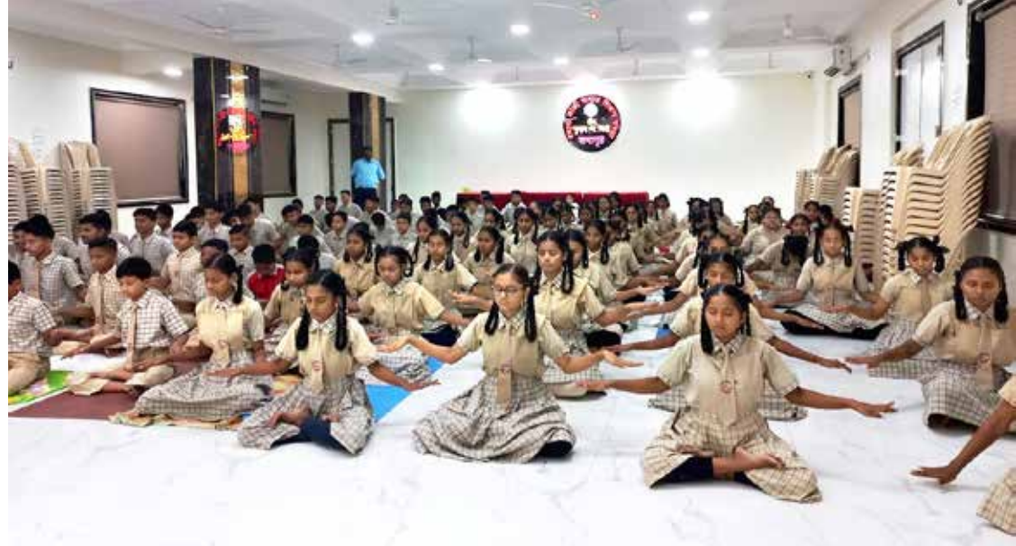
■ 印度孟买附近一所学校的学生学炼法轮功。

听到这里，我很欣慰，明白法轮大法真相“三退”后的生命，真的得救了；同时也感到一阵心酸，为其它村的人未能得到真相而惋惜。