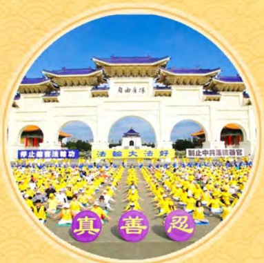
台湾学员庆大法弘传