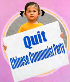
退党 / 团 / 队 人数已超四亿