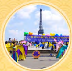
法国学员庆祝 世界法轮大法日