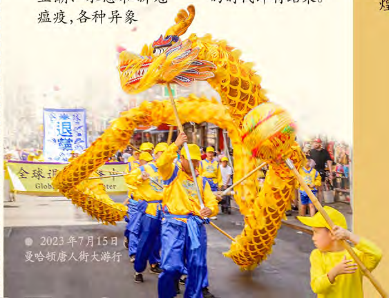
● 2023年7月15日 曼哈顿唐人街大游行