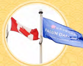
加拿大米尔顿市升旗庆大法日