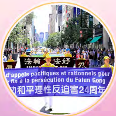
加拿大反迫害 24 周年游行