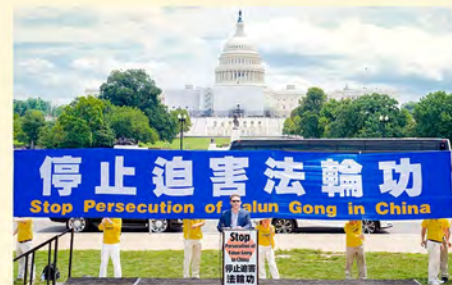
▲ 华盛顿 DC 集会

另外，还犯下了第300条“利用邪教组织破坏国家法律实施罪”。中共是全世界有目共睹的邪教，具足一切杀人的特征，受害者是全体中国人——在历次运动中，三年大饥荒被人祸饿死几千万人、“文革”、“计划生育”、“六四”、活摘法轮功学员人体器官牟取暴利、汶川地震、瘟疫人祸中的几亿死难者……中共邪教人员利用国家机器用谎言和暴力实施着罪恶的勾当。