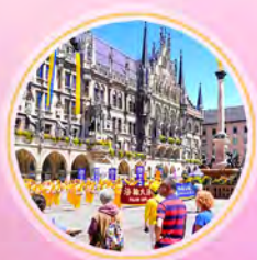
德国学员反迫害集会