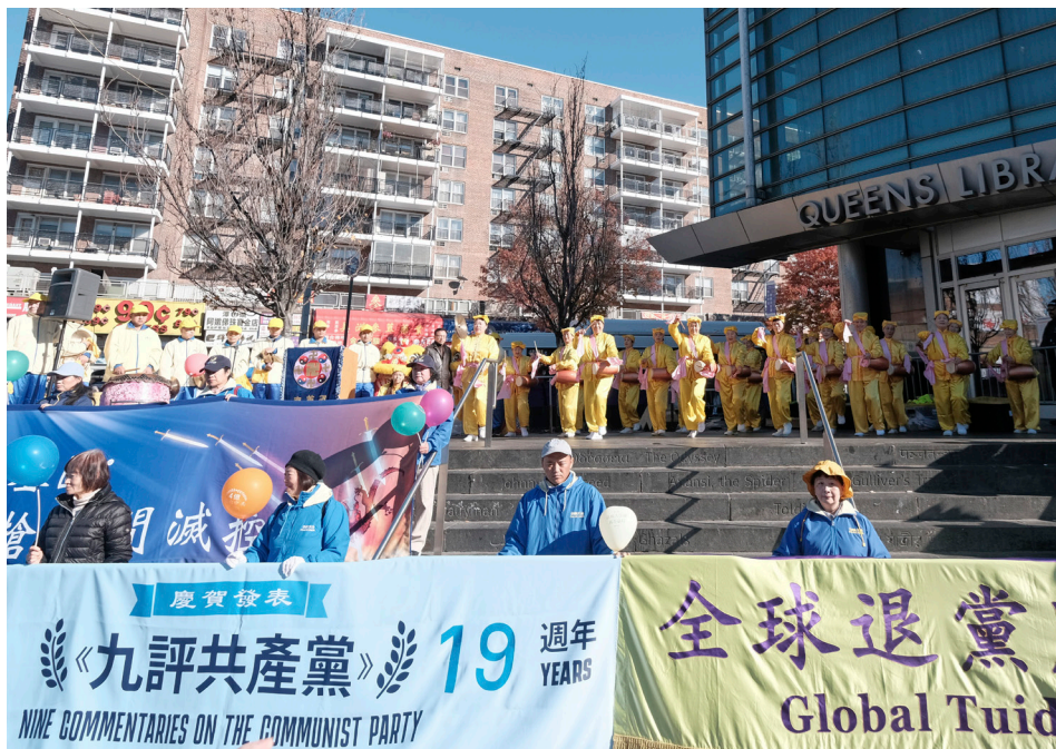
▲ 2023年11月19日是引发全球退出中共大潮的大纪元系列社论《九评共产党》发表19周年。全球退党服务中心当天在纽约华人社区法拉盛，隆重举办庆祝《九评共产党》发表19周年的集会。

教练嘲讽地说，你求你师父保佑你啊！我说，我不能为自己的利益随便求师父。教练又吃一惊，说：“佛、菩萨不是保佑人得好处的吗？”我说：“那是人自己说的，真正的佛、菩萨是要修炼人讲慈悲，讲为他人付出，而不是叫人升官发财生儿子的，那是贪婪。”教练又吃惊地说：“原来是这样啊！”