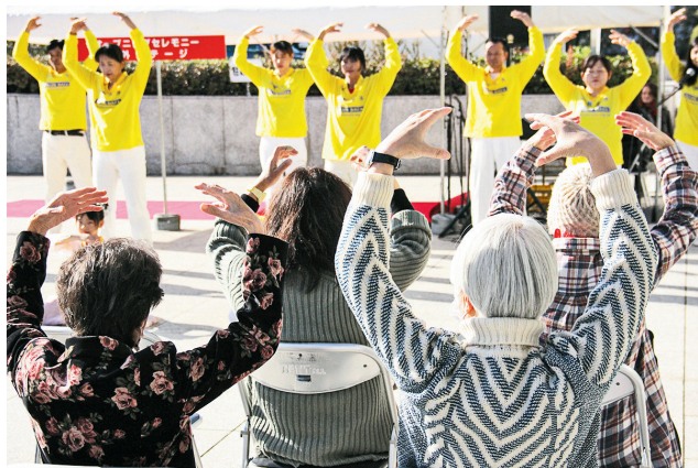
法輪功學員在「國際慶典 2023」的屋外舞台演示法輪功的五套功法，觀眾學煉。

十一月三日及四日，法輪功學員在「生涯學習慶典」中設置展位，發資料，介紹法輪功。首日，參加開幕式的東廣