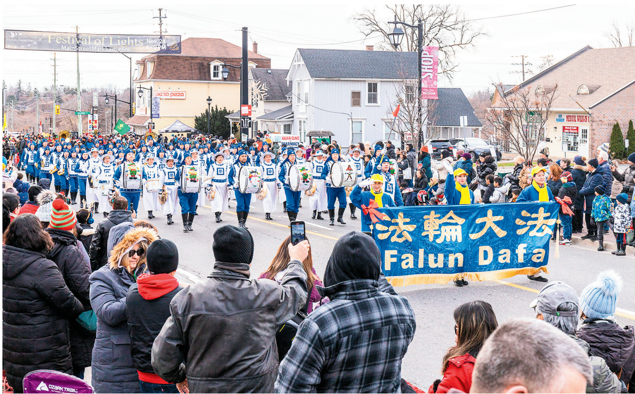
十一月二十五日上午，由多倫多法輪功學員組成的天國樂團參加了萬錦市的聖誕遊行。

人，不少華人觀眾把拍攝到的視頻發到微信朋友圈裏。與此同時，由多倫多學員組成的腰鼓隊參加了皮克靈 (Pickering) 的聖誕遊行。