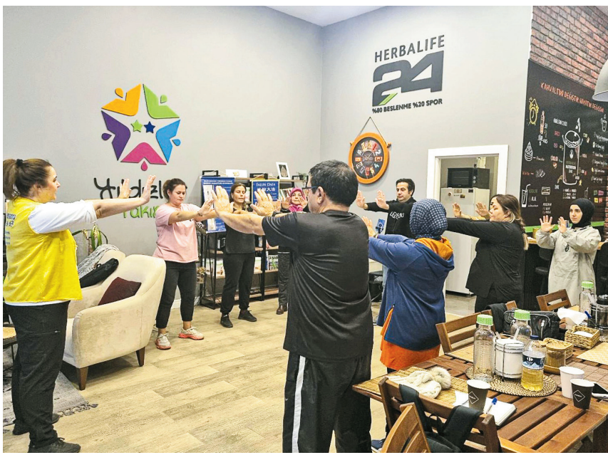
■法輪功學員受邀在伊斯坦布爾健康中心弘法。

功讓她身心平靜、放鬆：「(以前)我會打坐，練習呼吸。這是我第一次(煉法輪功)，(雖然期間)遇到一些困難，尤其是手臂上的動作，但我感到非常平靜和放鬆。我放下一切，只想感受(煉功的)那一刻，我感覺到體內有(好的)能量，不好的能量消失遁形。我感覺到這些，我非常高興，很感謝你們。」