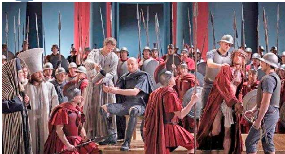
■ 排练《耶稣受难记》场景。