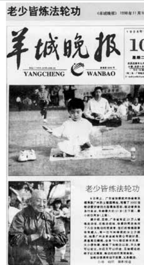
◀ 中共迫害法轮功之前，广州《羊城晚报》正面报导法轮功：老少皆炼法轮功（1998年）。

法轮功并不排斥医院治病。《转法轮》第七讲中说：“医院还是能治病的，只不过它的治疗手段是常人那个层次的，而那个病却是超常的，有些病是相当大的。