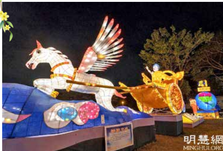
▲ 法轮功学员制作的《神驹天车》，多次参加台湾元宵节灯会。