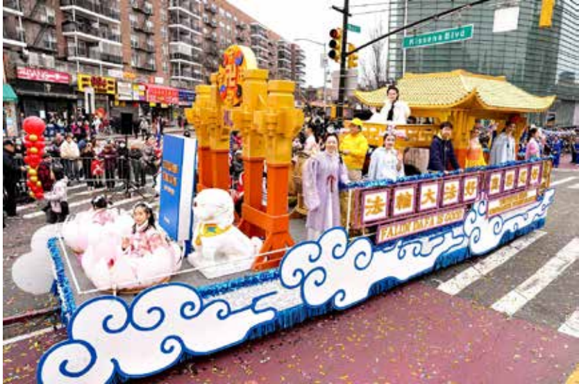
▲ 法轮功学员参加二零二四年纽约法拉盛中国新年游行。