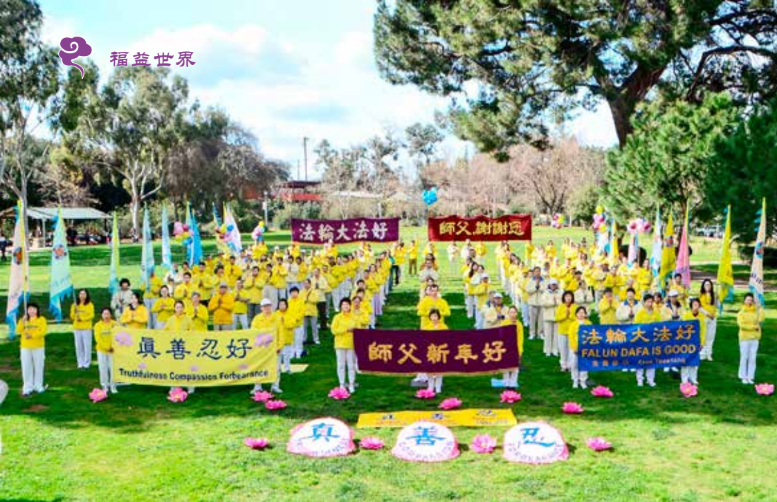
▲ 美国洛杉矶部分法轮功学员相聚一起，向李洪志师父送上新年祝福。