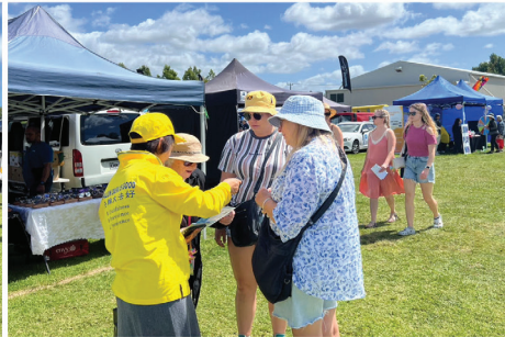
■ 人们来展位了解法轮功。

退伍军人部长、国防部副部长和移民部副部长。他也是奥克兰北部和西北部农村地区选区的议员。当天他也参加了展会，并驾驶拖拉机加入游行队伍。