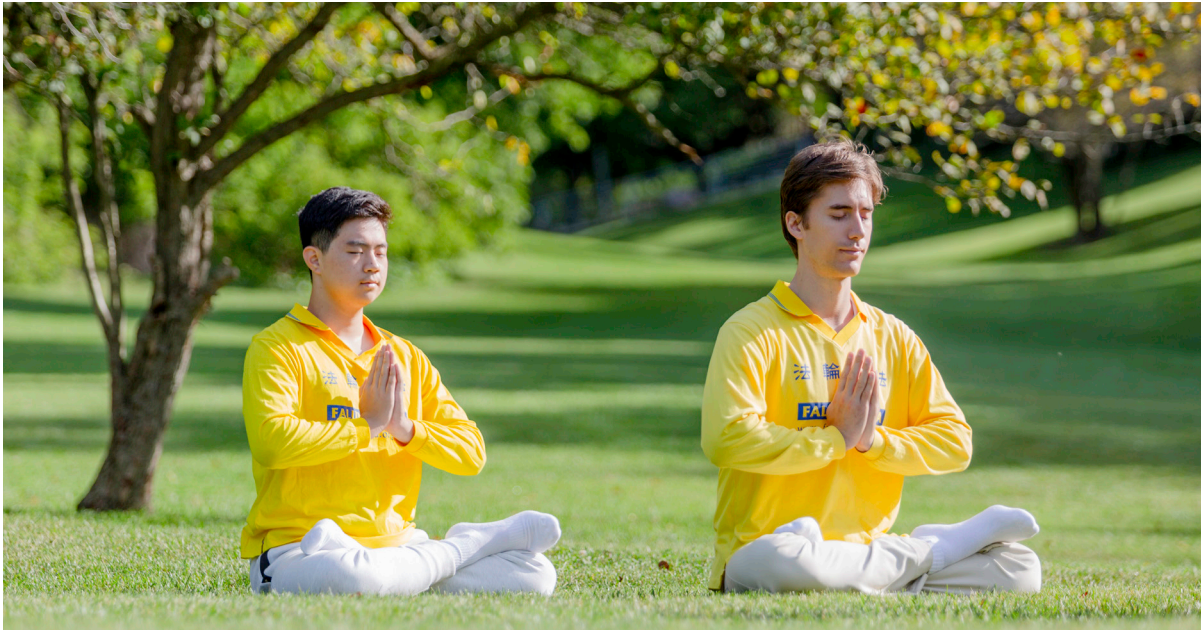
◀ 加拿大中西方青年法轮大法弟子，在炼法轮功。