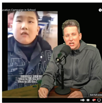
■ 小學生被教育長大了要殺美國人、日本人（視頻截圖）