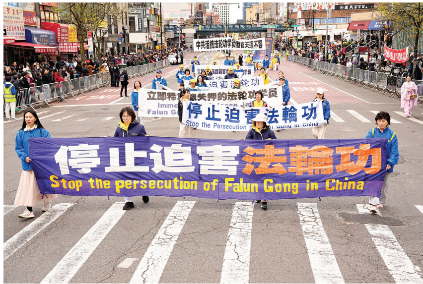
■ 紐約法輪功學員2024年4月21日舉行盛大遊行，紀念中國法輪功學員1999年4月25日和平上訪25周年。

爭，是在八九年六四後為了自由、為了宗教信仰進行的最大規模的抗爭。為甚麼只有法輪功學員去抗爭？因為我看到了：法輪功學員——這些普通人，他們修煉了真、善、忍後，變成能夠自我組織、互相幫助，展現出力量——好像是跟一般的中國人不一樣了，其實是他們被修復了，他們人性的光明展現出來了，法輪功在為中國人