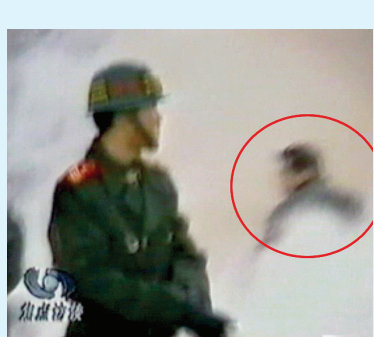
↑ CCTV「自焚」節目慢動作分析 ② 一名穿大衣的男子正好站在出手打擊的方位，仍然保持著一秒鐘前用力打擊的姿勢

畫面只有短暫的幾秒，可是鏡頭一放慢，仍然捕捉到了凶手擊打後來不及扭頭逃走的身影。中共製造死人事件栽贓法輪功，目的是挑起民眾對法輪功的仇恨。