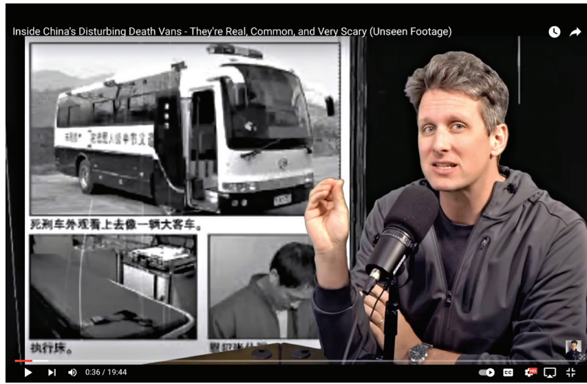
■ 中共的死亡麵包車（視頻截圖）

中共的死亡麵包車（視頻截圖）大家可以根據自己信息和經驗，來研究和推斷：大陸為何出現「死亡麵包車」？為何向大陸公眾宣傳「死亡麵包車」？推廣死亡執行車與移動焚屍車，是否與活摘器官行為擴展到更